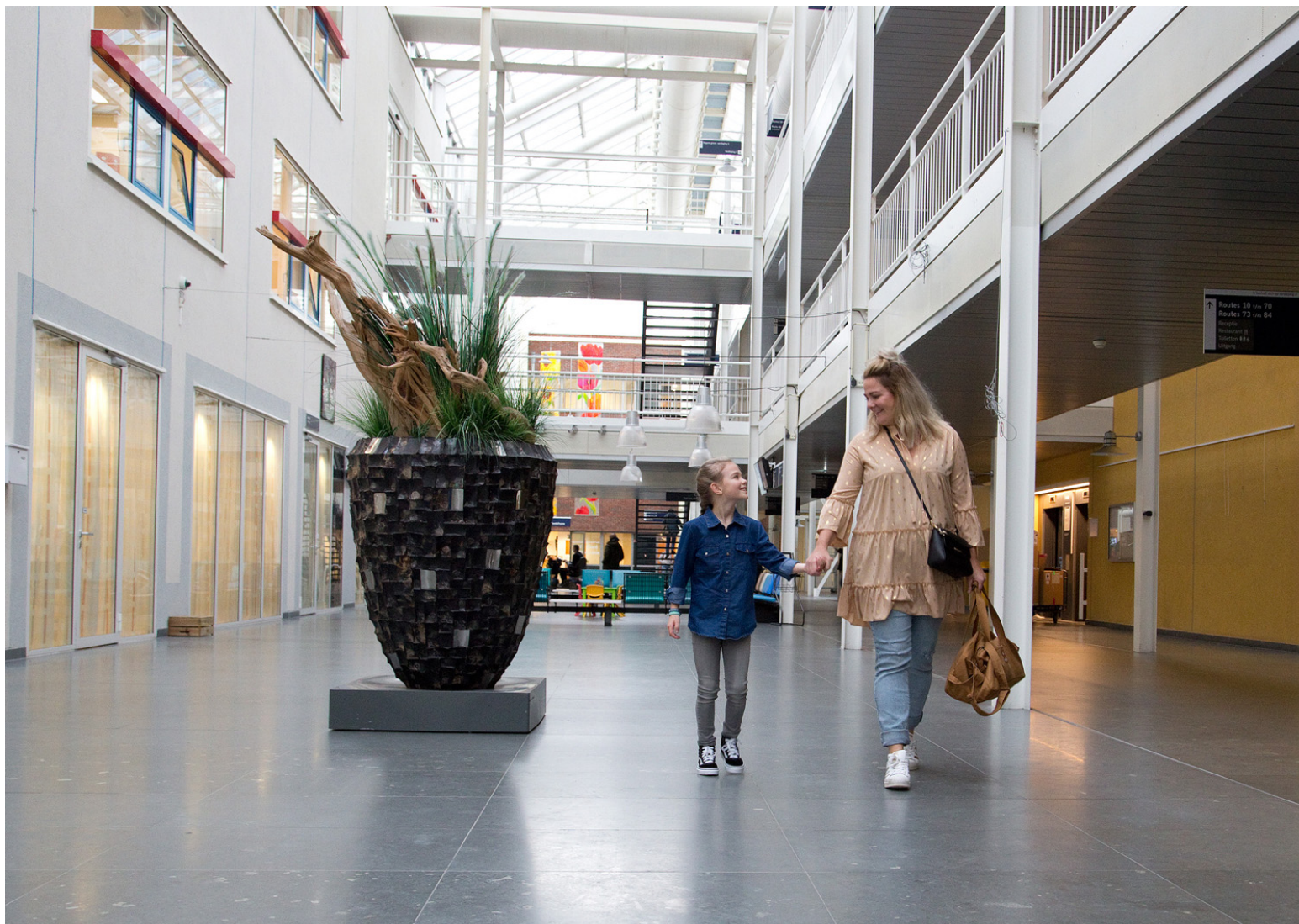
Het is een klein stukje lopen naar de kinderafdeling.